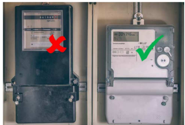
Abbildung 4: Ferraris-Zähler (links), Zweirichtungszähler (rechts),